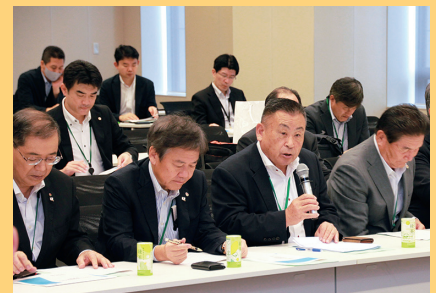
公明党政策懇談会で要望する赤田英博幹事長 (令和6年9月12日)