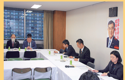
自民党政策懇談会で要望する赤田英博幹事長 (令和6年11月20日)