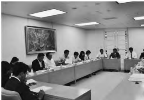
都議会民主党ヒアリング

■ 9月27日 都連所属国会議員並びに選挙区支部長出席のもと自民党本部にて、平成24年度国家予算を含めたヒアリングが開催さ