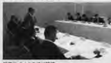
写真③ みんなの党に陳情