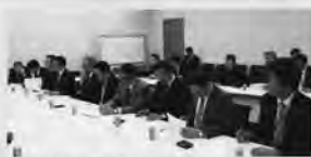
写真① 公明党へ要望書提出