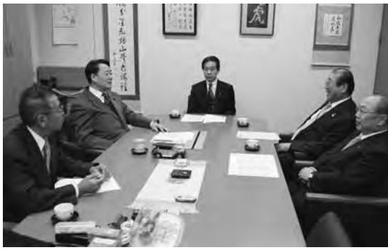
平成 24 年 2 月 3 日衆議院第一議員会館にて

ります。緑というものは、所有者だけでなく、その地域の人も共有できるものですね。私たちの利益で言うと、相続が出て、宅地が活性化するほうが流通にはいいのですが、これは逆に、先生のおっしゃる、自分の利益ではなく「国民のため」「都民のため」という考え方をすれば、都市における相続とは何かという観点で贈与税や相続税を考えていただきたい。