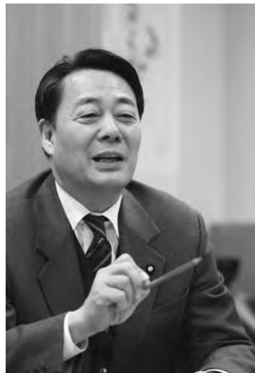
海江田元経済産業大臣