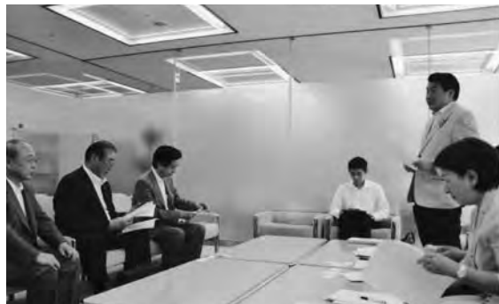
都議会公明党ヒアリング

れ要望事項を提出しました。 ■ 12月9日 賃借人の居住の安定を確保するための家賃債務保証業の業務の適正化及び家賃等の取立て行為の規制等に関する法律案」が、平成23年12月9日の衆議院国土交通委員会理事会上において「廃案」となりまし