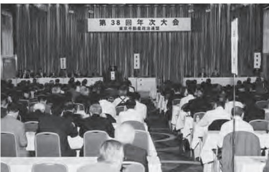
第38回年次大会（京王プラザホテルにて）